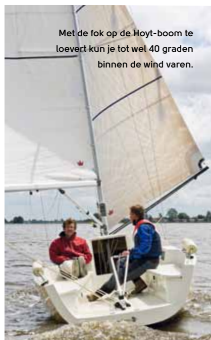
Met de fok op de Hoyt-boom te loevert kun je tot wel 40 graden binnen de wind varen.

gezeild. Want Gijs heeft met z'n Beaufort 8.3 een boot bedacht die veel leuker is dan we op basis van die ene vraag destijds hadden kunnen vermoeden. Slim, simpel, comfortabel en vooral heel prettig om te zeilen, ook in relatief ondiep water. Bovendien met een uitstraling die er zijn mag. ⚓