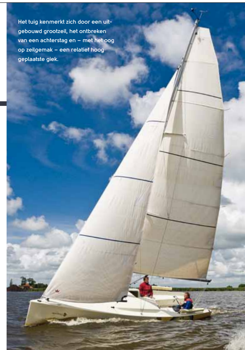
Het tuig kenmerkt zich door een uitgebouwd grootzeil, het ontbreken van een achterstag en – met het oog op zeilgemak – een relatief hoog geplaatste giek.

zeven knopen, maar dit is wel een koers waarop je wat alerter moet zijn. De boot heeft natuurlijk een fiks grootzeil en heeft bij te veel schootspanning de neiging om wat loefgierig te worden. Wat minder schootspanning dus, en wat meer spanning op de neerhouder. Het werkt; maar je moet alert blijven om hem in het goede spoor te houden. Ga je ruimer varen, dan bewijst de Hoyt-boom onomstotelijk z'n voordelen. Het probleem van een keerfok (te weinig effectief oppervlak op ruime koersen) heb je namelijk niet. Het voorzeil houdt z'n vorm en blijft voortstuwing genereren. Voor de wind is het plaatje helemaal compleet met de Hoyt-boom te loevert, waardoor je het voorzeiloppervlak optimaal blijft benutten. De mop is bovendien dat je de boom tot wel een graad of veertig binnen de wind te loevert kunt houden. Daarna waait hij eenvoudig naar de goede kant, zonder dat je iets hoeft te doen. Voor het echt sportieve gevoel is de Beaufort 8.3 uitgerust met een gennaker. Niet overdreven groot – de schoot heb je gewoon in de hand. Dat kan ook niet anders, want naar lieren zul je op deze boot tevergeefs