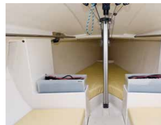
ONDER Het interieur in het prototype. De accu's links en rechts gaan op bouwnummer één onder de banken.